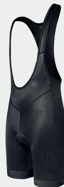
SKIN PANTS BIB 8h+

Pour créer ces protections multicouches, la marque Allemande s'est associée à la société italienne ELASTIC INTERFACE.